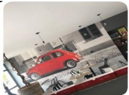
La Piccola Traviata

1 rue des Maréchaux 71150 FONTAINES 03 85 93 17 12